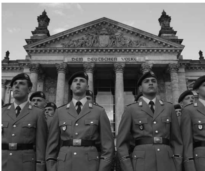
Neue deutsche Bundeswehrrekruten vor dem Reichstag

Der Iran sichert aggressiv seine ausländischen Beteiligungen am Roten Meer – und brüstet sich damit, wie er sie nutzen könnte!