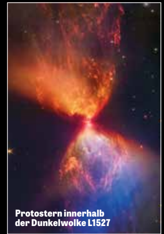
Protostern innerhalb der Dunkelwolke L1527

verehrt nur die Schöpfung und nicht den Schöpfer! (Römer 1, 25). Die Menschen scheinen den Gott hinter all dem nicht zu sehen!