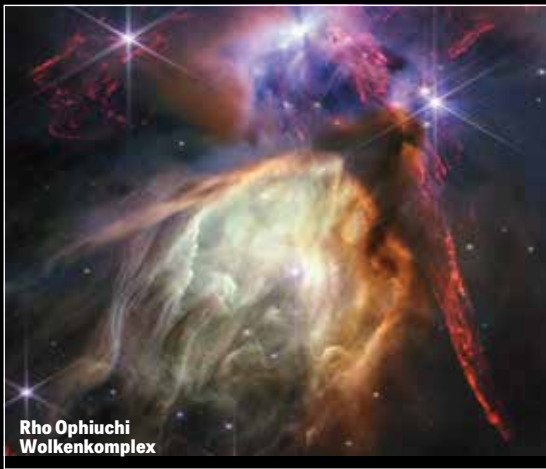
Rho Ophiuchi Wolkenkomplex