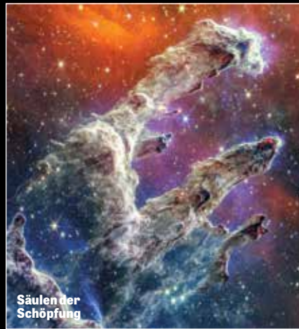
Säulen der Schöpfung