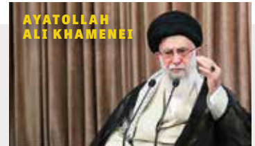
AYATOLLAH ALI KHAMENEI

Ein nuklear bewaffnetes Saudi-Arabien, das mit einem nuklear bewaffneten Israel verbündet ist, würde das Machtgleichgewicht im Nahen Osten drastisch gegen den Iran verändern, selbst wenn dieser seine ersten Atomwaffen einsetzt. Khamenei hatte also nicht nur ein großes Interesse daran, Juden in ihren Häusern zu töten, sondern auch – wie US-Außenminister Antony Blinken zugegeben hat – die Massaker zu nutzen, um die israelisch-saudischen Verhandlungen zu stören.