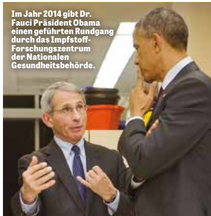
Im Jahr 2014 gibt Dr. Fauci Präsident Obama einen geführten Rundgang durch das Impfstoff-Forschungszentrum der Nationalen Gesundheitsbehörde.

Der Kongressabgeordnete Guy Reschenthaler deckte auf, dass in der Obama-Ära 1,1 Millionen Dollar an Steuergeldern an das Wuhan Institut für Virologie geflossen waren, um ein künstliches Virus zu schaffen, indem ein Stachelprotein aus einem wilden Fledermaus-Coronavirus in ein an die Maus angepasstes SARS-CoV-Rückgrat ein-