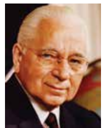
Herbert W. Armstrong

In einem Brief vom 29. Nov. 1971 schrieb Herbert W. Armstrong: „Vor zwei Jahren schrieb ich von unserem Campus in England EINEN Brief an alle Bezieher der Klar & Wahr , einige Stunden nachdem ich im Fernsehen gesehen hatte, wie ein menschlicher Fuß zum dritten Mal den Mond betrat. Das startete einen Gedankengang in mir. Einerseits musste ich die Frage überlegen: Wie UNGEHEUERLICH BRILLANT ist der menschliche Verstand? Nicht nur, dass er die Hilfsmittel für einen Flug zum Mond und zurück entwerfen und produzieren kann – sondern auch all die fabelhaft komplizierten Mechanismen – wie moderne Computer! Und doch ist der Mensch außerstande gewesen, seine eigenen Probleme hier auf Erden zu lösen! Und heute wächst die Besorgnis der Menschen über diese Probleme und Übel immer mehr.“