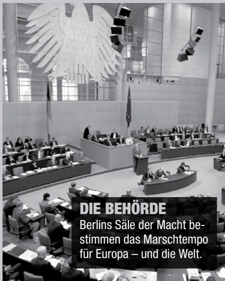
DIE BEHÖRDE Berlins Säle der Macht bestimmen das Marschtempo für Europa – und die Welt.

Das alles ist dem alten Nazitraum zu nahe, um Zufall zu sein.