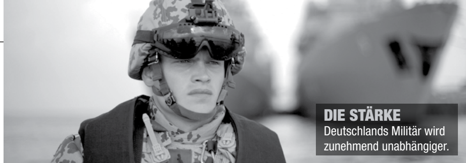
DIE STÄRKE Deutschlands Militär wird zunehmend unabhängiger.