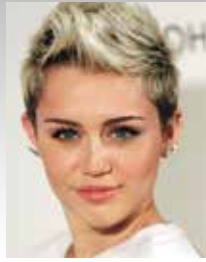
Sängerin/Schauspielerin Miley Cyrus

1994 - Berühmt für den Konsum von Marihuana und legalen Pharmazeutika