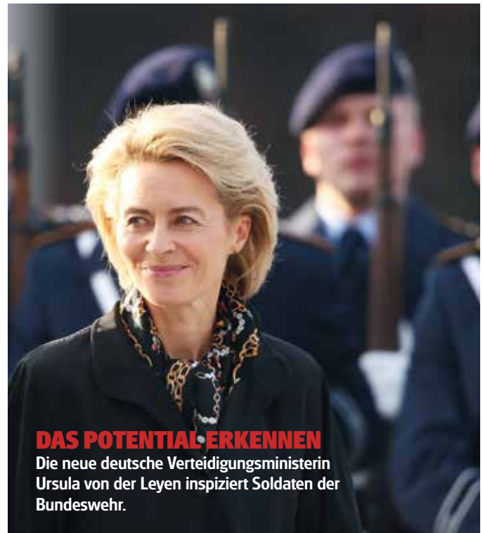
DAS POTENTIAL ERKENNEN Die neue deutsche Verteidigungsministerin Ursula von der Leyen inspiziert Soldaten der Bundeswehr.

Während einer Radiosendung im Jahre 1958 sagte Murrow: „Niemand hat bis jetzt eine Formel gefunden, die dem deutschen Volk die Lust auf