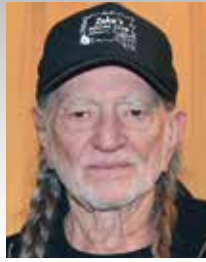
Sänger/Liedermacher Willie Nelson