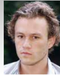
Schauspieler Heath Ledger

1963-2012 Starb an einer Überdosis von Kokain und legalen Arzneimitteln