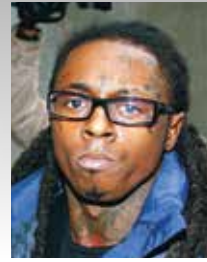
Rapper Lil Wayne

1982- Bekannt für den Konsum von Marihuana, Crack, legalen Arzneimitteln, mehrere Verhaftungen