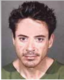
Schauspieler Robert Downey Jr.

1965- Bekannt für den Konsum von Kokain und Heroin