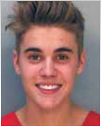
Sänger Justin Bieber

1994 - Berühmt für den Konsum von Marihuana und legalen Pharmazeutika