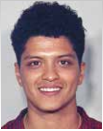
Sänger Bruno Mars