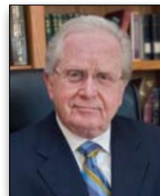
GERALD FLURRY CHEFREDAKTEUR

Es gibt eine zerstörerische Kraft hinter der ultraliberalen Fakultät, die das Bildungswesen in Amerika kontrolliert. Die Zivilisation steht auf dem Spiel!