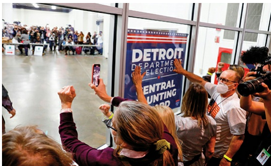
Anhänger von Präsident Trump in Detroit, Michigan.

Ich weiß nicht genau, wie sich das alles abspielen wird, aber ich glaube, dass Gott das zulässt, um sicher zu stellen, dass das Böse und die Korruption in Amerika enthüllt werden!