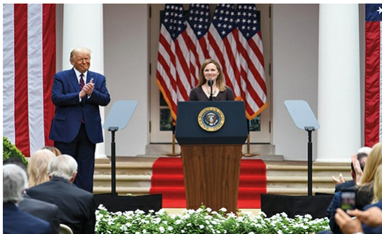
Amy Coney Barrett wurde für den Obersten Gerichtshof bestätigt.

Er wird als „Priester von Bethel“ beschrieben (Vers 10). Bethel ist ein Name für Gottes Haus, das geistlich die wahre Kirche Gottes ist. Wie ich in meiner Broschüre Der Löwe hat gebrüllt erkläre, ist dies eine prophetische Sprache für einen Prediger, der aus der weltweiten Kirche Gottes (WKG) stammt. Diese Kirche hat ihre Lehren in den letzten Jahren völlig geändert und sich zu einer protestantischen Mainstream-Gruppe namens Grace Communion International entwickelt.