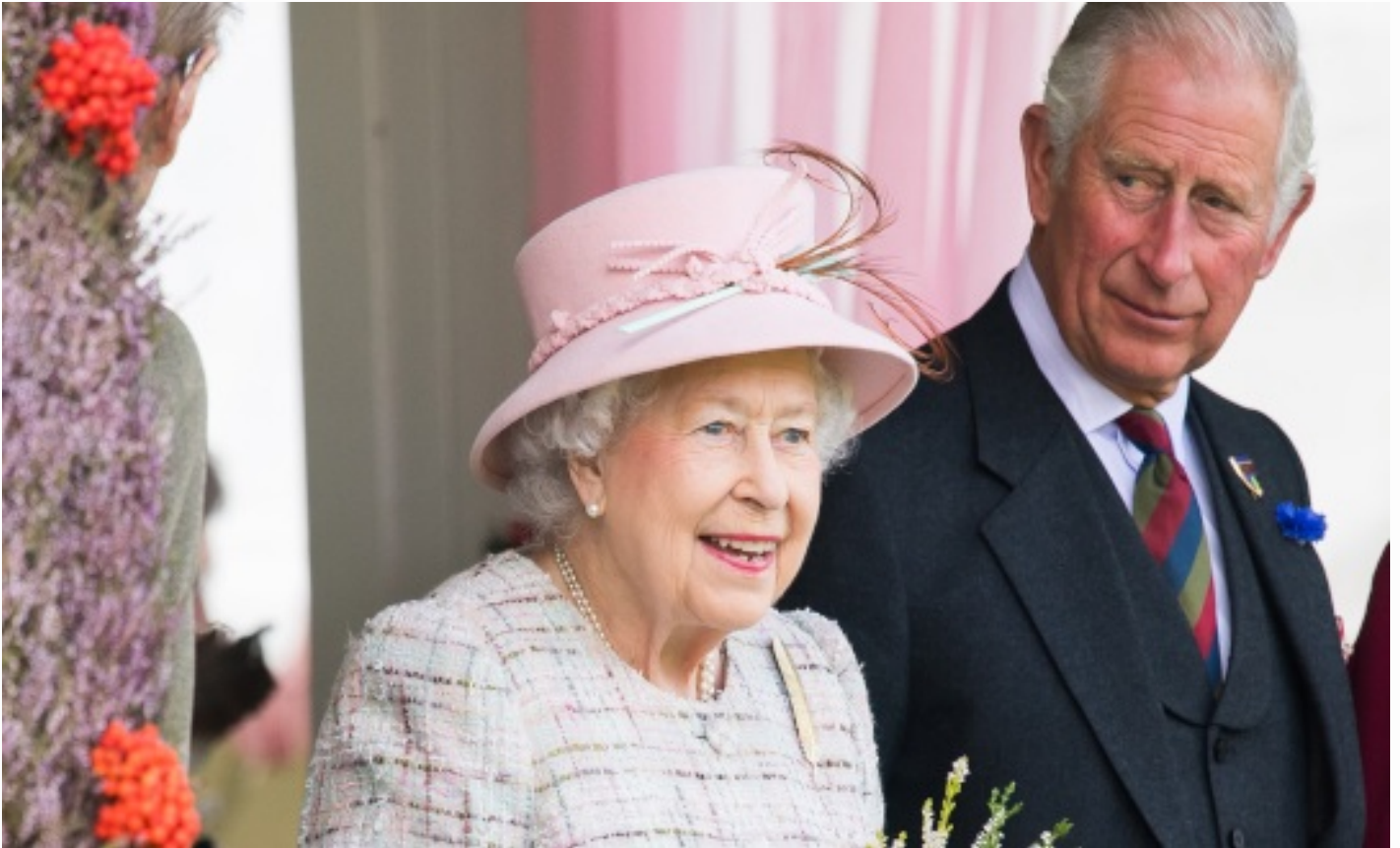
KÖNIGIN ELIZABETH II. UND PRINZ CHARLES